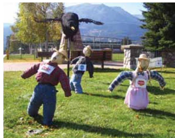
École Desrochers a remporté la catégorie « métaphorique ».

JASPER – Entre les 17 et 28 septembre derniers, la communauté de Jasper a participé à leur premier concours annuel d'épouvantail. Pour le concours il y avait trois différentes catégories : « épeurant », « métaphorique » et « naturel ». Ensuite, les trois juges locaux sont allés autour de la ville pour évaluer tous les épouvantails. Deux groupes d'élèves de l'école Desrochers ont participé au concours cette année : les élèves de la maternelle et ceux du secondaire (7 e à 12 e ).