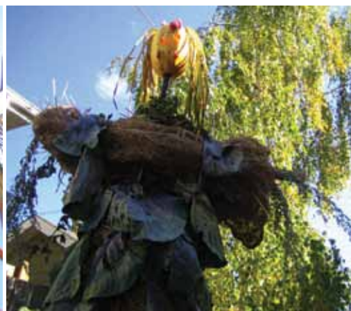
Ellen Merilovich gagnant de la catégorie « naturel ».